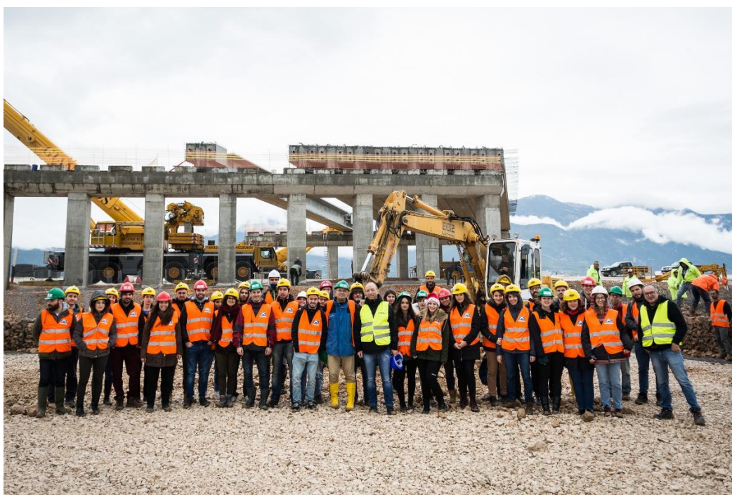
Ομαδική φωτογραφία μπροστά από μεσόβαθρο γέφυρας