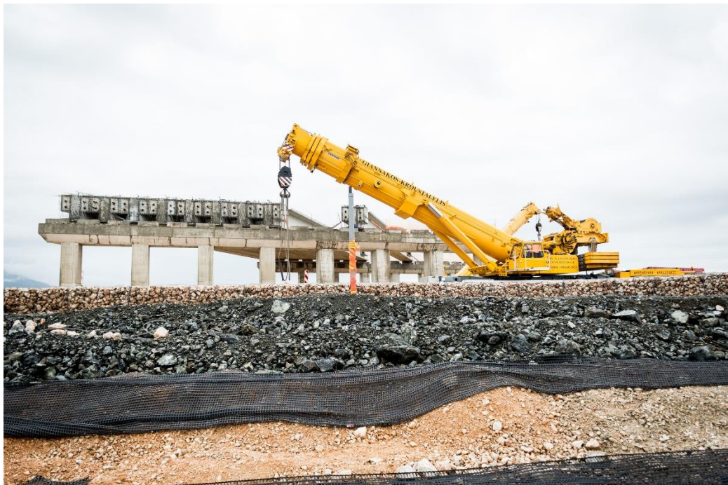
Λεπτομέρεια κατασκευής επιχώματος με γεώπλεγμα ως σπλισμό