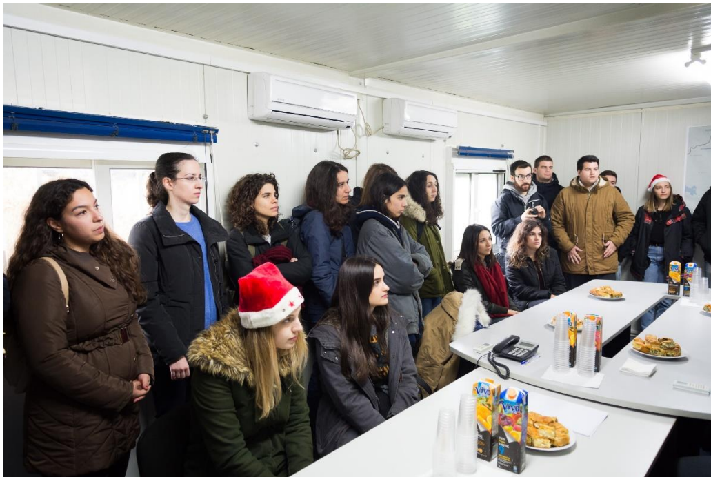
Ενημέρωση για το έργο στα γραφεία του εργοταξίου