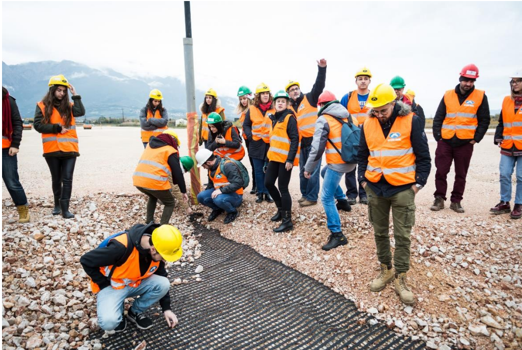
Μπροστά σε «μάρτυρα» καθιζήσεων του υπο-κατασκευή επιχώματος πρόσβασης