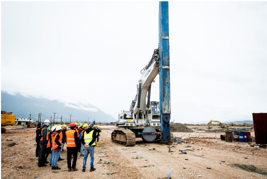
Έμπηξη πλαστικών στραγγιστηρίων