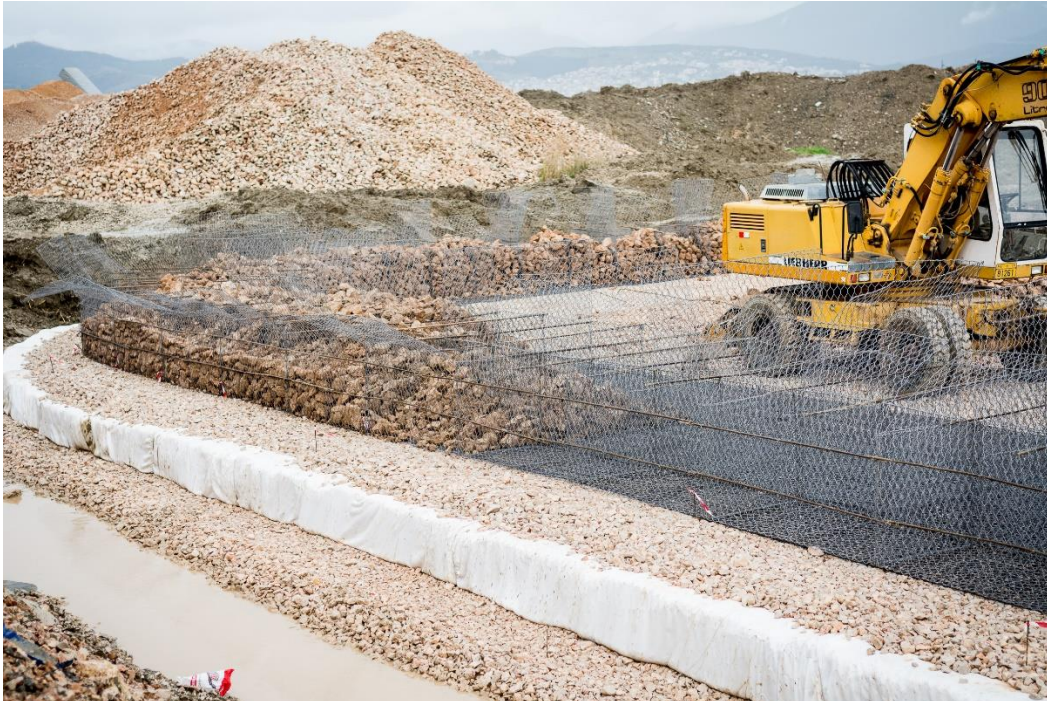
Υπο-κατασκευή συρματοκιβώτια πληρωμένα με λιθορριπή