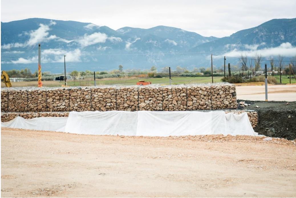
Τοποθετημένα συρματοκιβώτια πληρωμένα με λιθορριπή