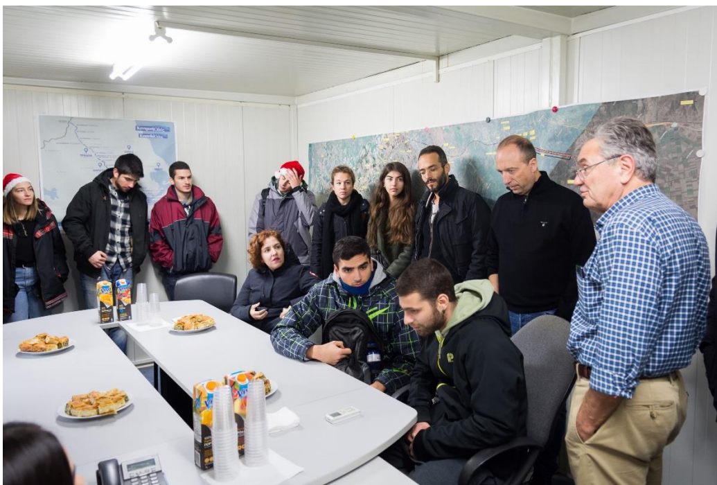
Ενημέρωση για το έργο στα γραφεία του εργοταξίου