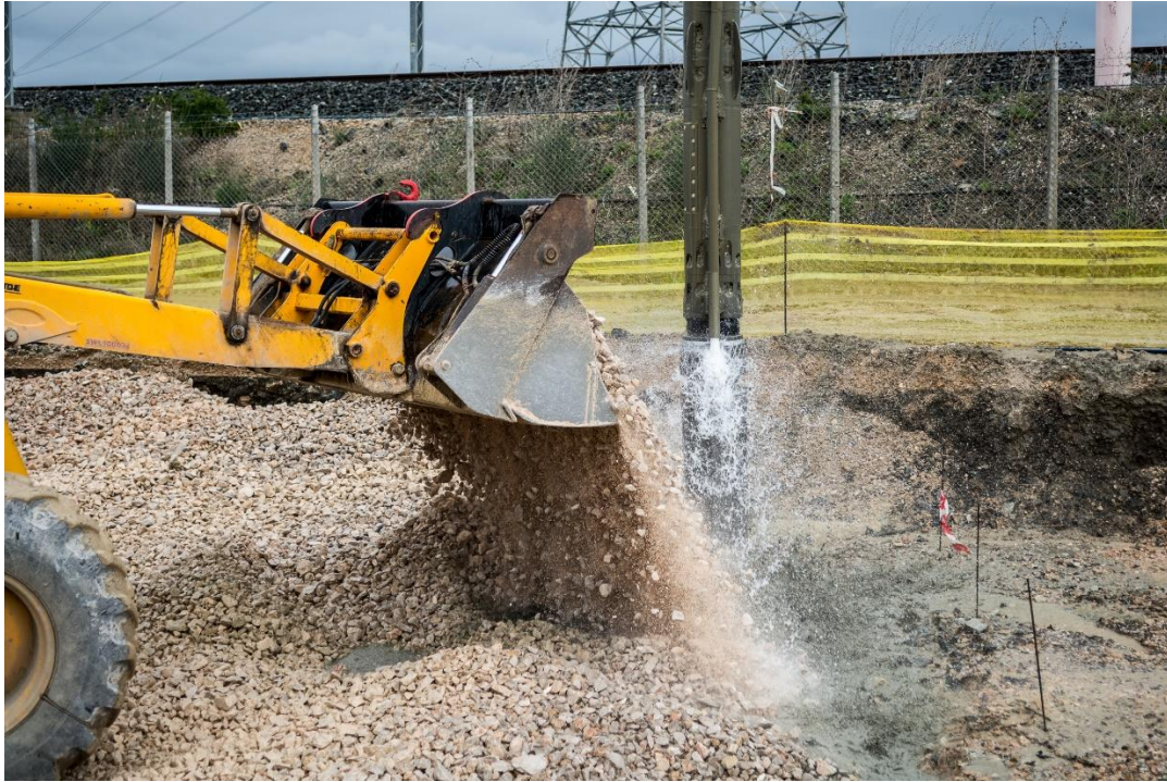
Κατασκευή χαλικοπασσάλων: πλήρωση με χάλικες