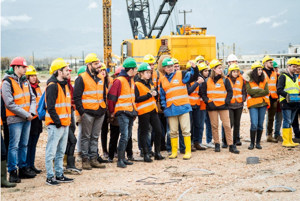
Ενημέρωση... επί καννάβου πλαστικών στραγγιστηρίων