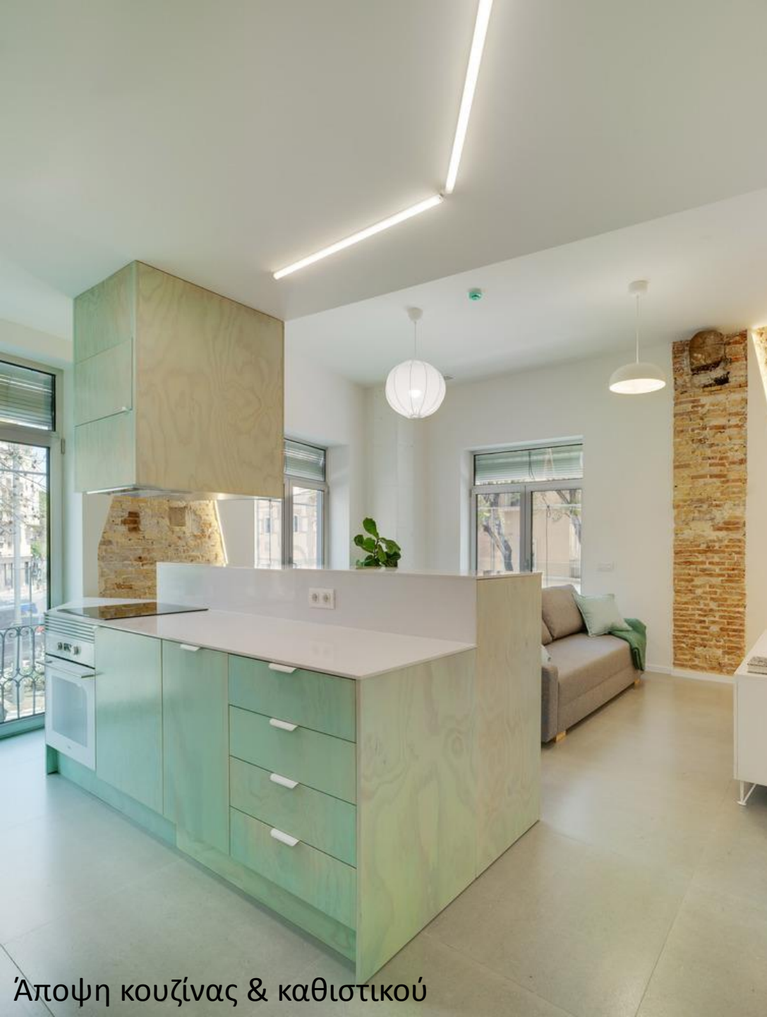
Άποψη κουζίνας & καθιστικού